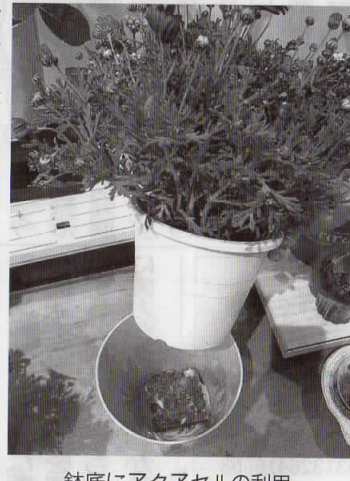
鉢底にアクアセルの利用

TIION 新発想で毎日 に彩りを「を開催した。 会場では、3社がコラ ボレーションし、花き業 界が抱える「人員不足に よる商品管理問題(ロス の増大)」「既存顧客離 れ(売り上げ減少)」「な ど多くの課題に取り組ん だ新発想商品として、「フ ードパッケージを利用し た新しい魅せ方の新商 品」「店頭での水やりの 見える化(簡素化)」、 「小ロット・バーコード 付き商品」などを「saxia (サクシア)」「ブレ ランドとして一堂に集め お披露目した。 これらのアイテムに は、ハクサンが取り扱う 見せているという。