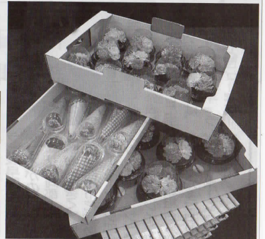
輸送等の課題解決へパッケージ工夫