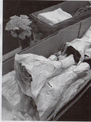
短寸指定で入り数増やす