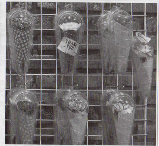
他の商品と組み合わせられる花の1本売りも提案