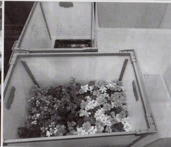
コンテナ内部の一例