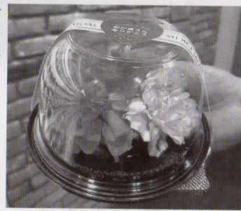
スイーツカップを花に利用

パック東京支店1階展示 ルームで3社合同新商品 展示会「FLOWER & LIFE INNOVA